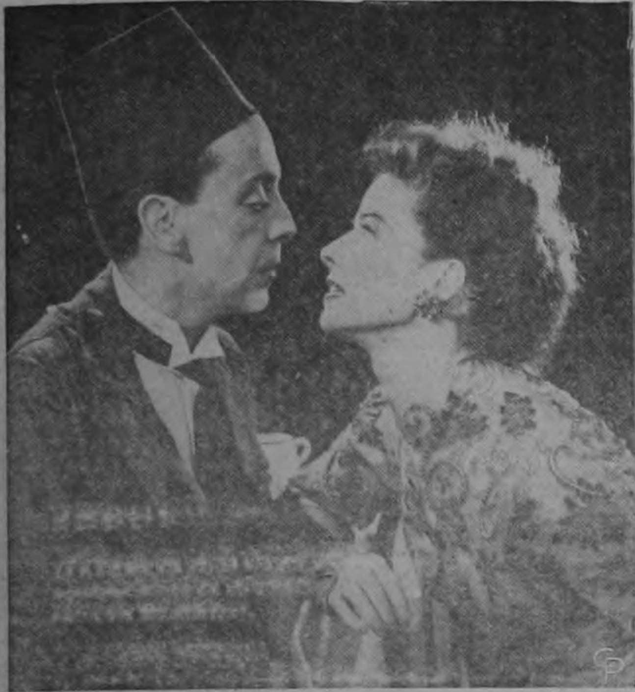
Robert Helpman (El Doctor) escucha impasible a Katherine Hepburn (La Millonaria) en la obra de Shaw que está presentándose en Nueva York.