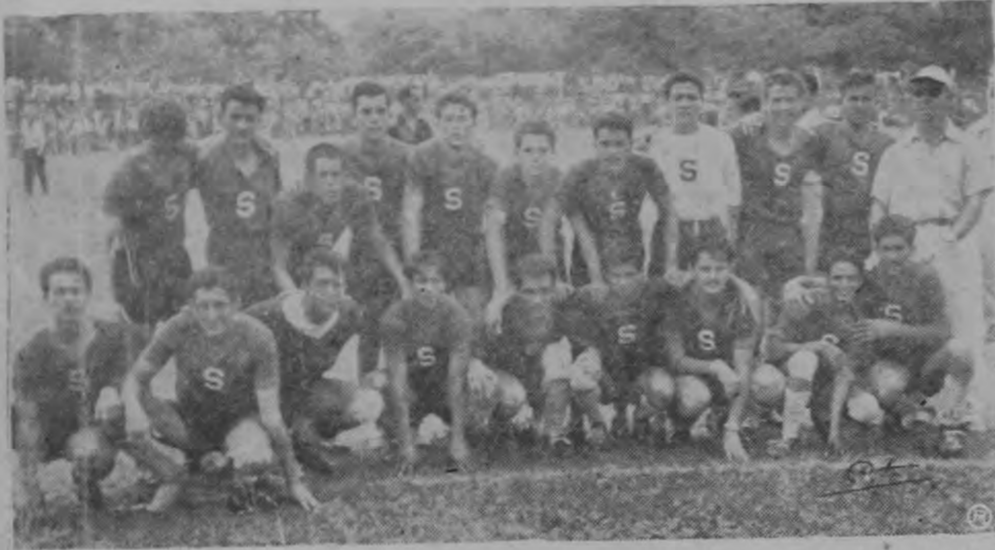
La gráfica nos presenta al "Deportivo Saprissa" que en esta mañana saltará a la cancha del Estadio Nacional para enfrentarse al cuadro de Moravia, en su último partido del Campeonato de 1952. De ganar este partido se adueñaría del título que está en poder del Herediano.