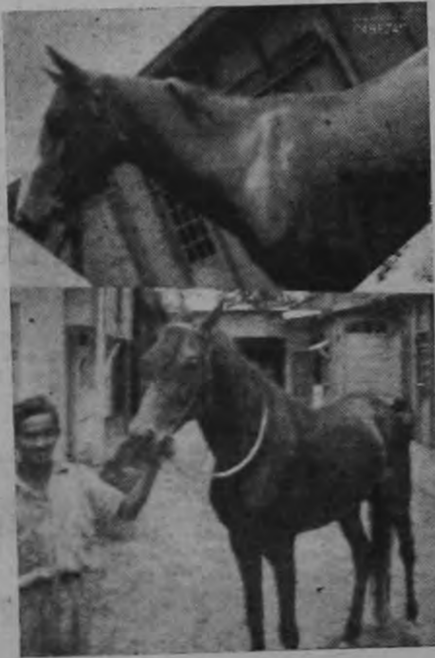
Dos de los Favoritos para el 'Clásico Presidente' de hoy: Cartaginés y Eclipse respectivamente.